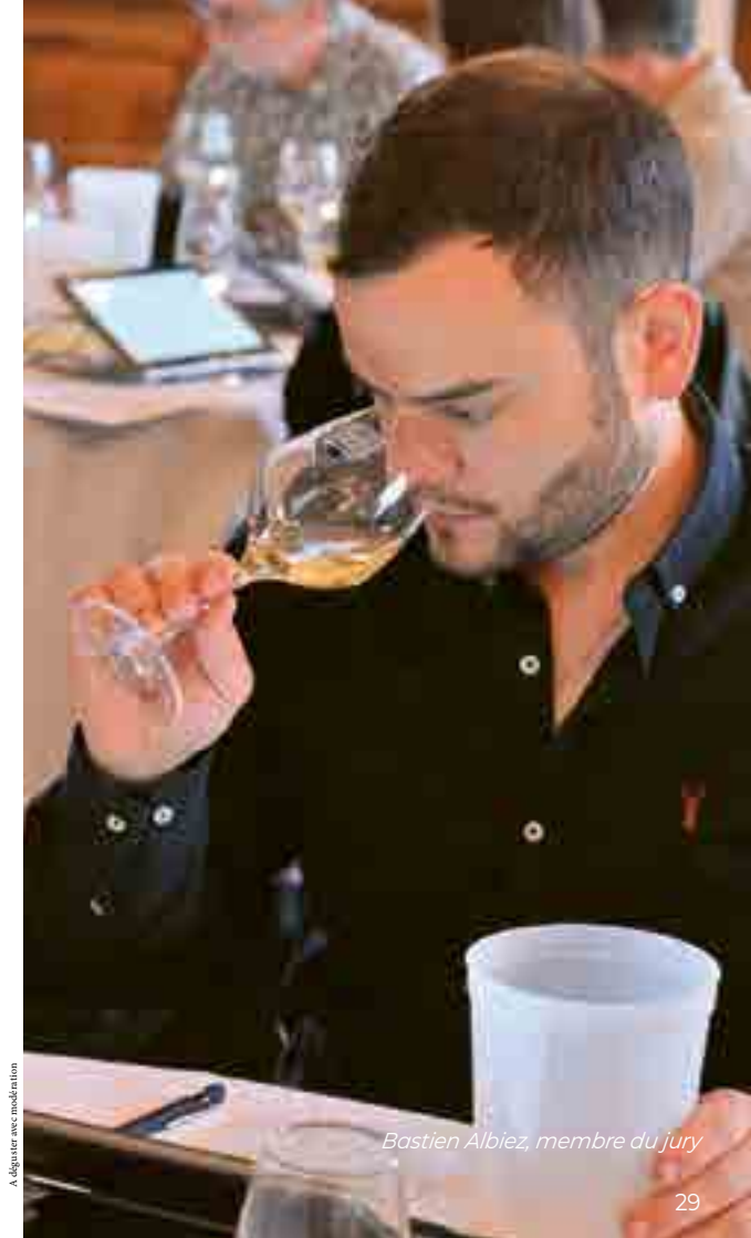
A déguster avec modération